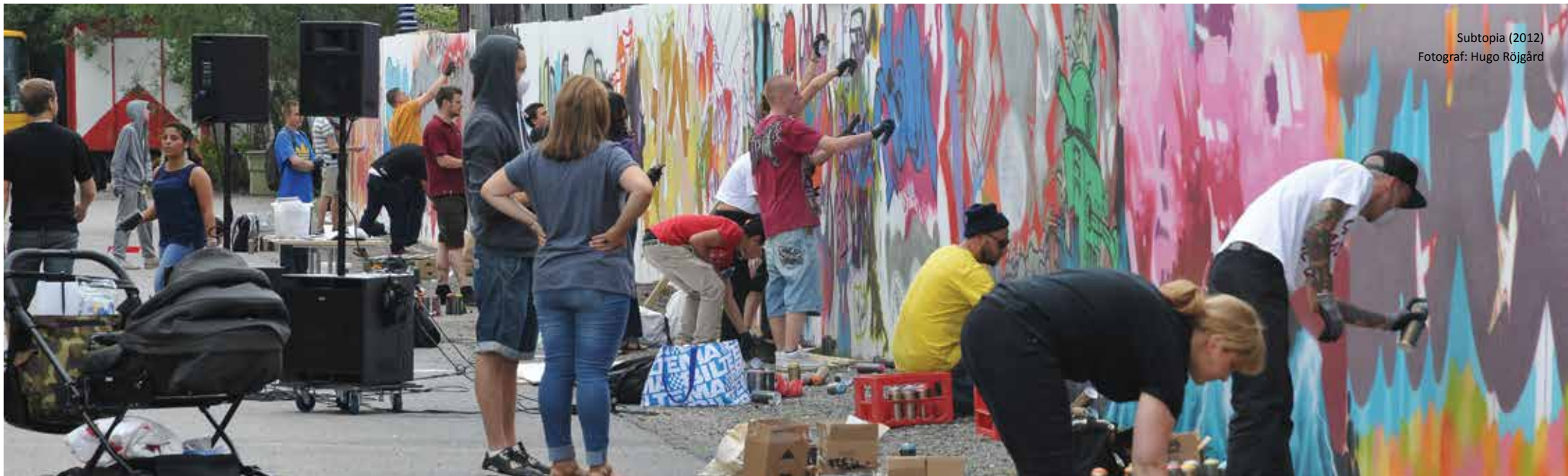
Subtopia (2012)