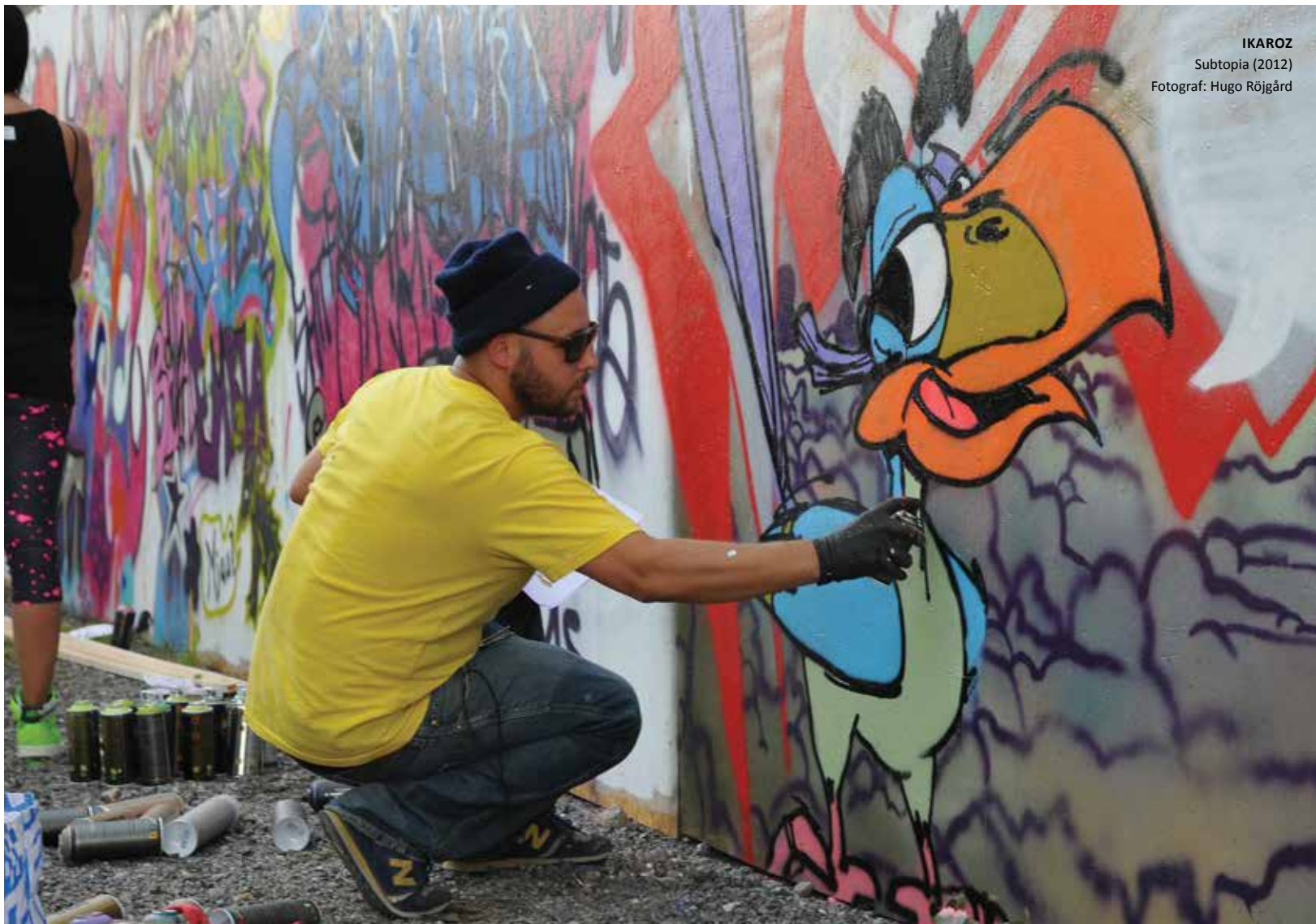
IKAROZ Subtopia (2012)

En permanent målning (ofta större) görs på en vägg. Denna kanske byts ut efter ett par år eller inte alls.