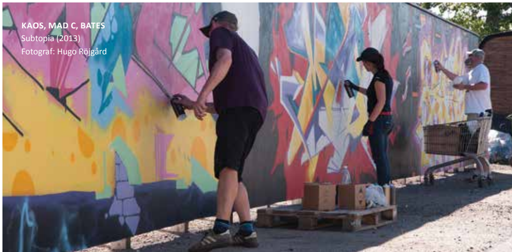
KAOS, MAD C, BATES Subtopia (2013)