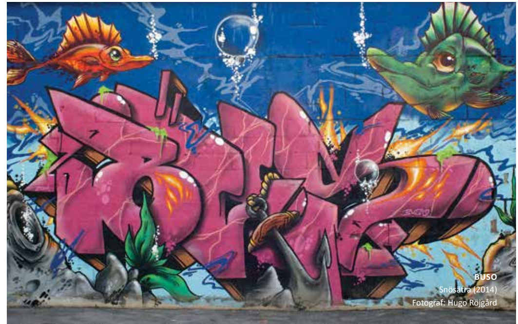
BUSO Snösättra (2014)