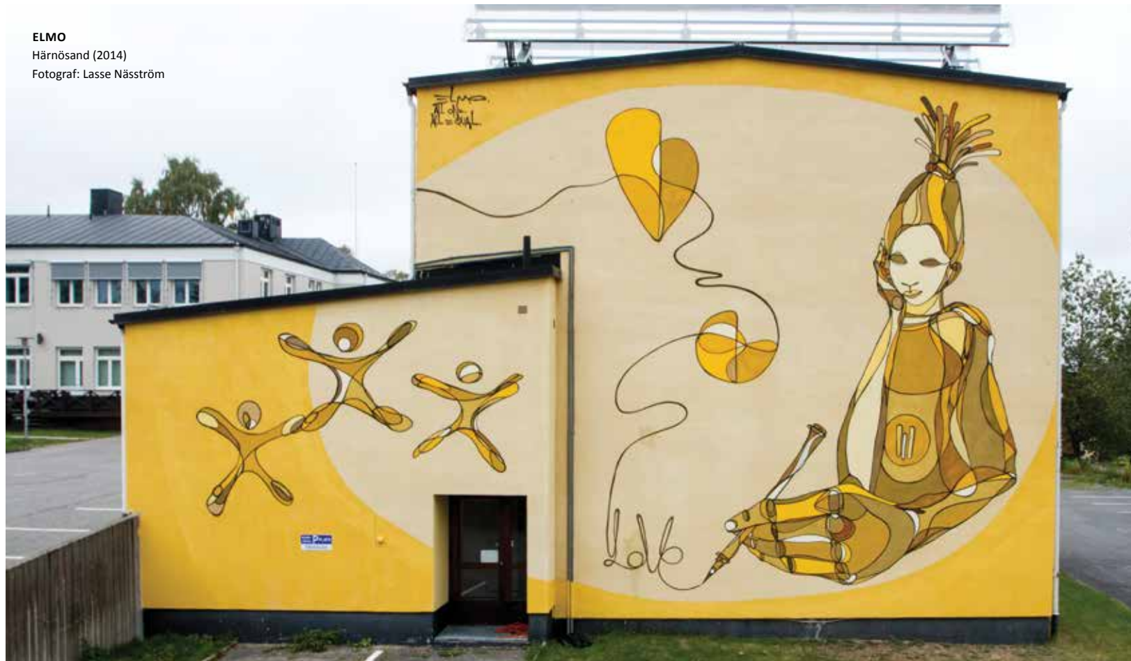
ELMO Härnösand (2014)

Än finns det ingen öppen vägg att måla på i Härnösand, men Graffitifrämjandet Härnösand tror att man med Gatukonstveckan lagt en bra grund för fortsatta samtal med kommunen och en väg framåt i frågan om en öppen vägg i staden.