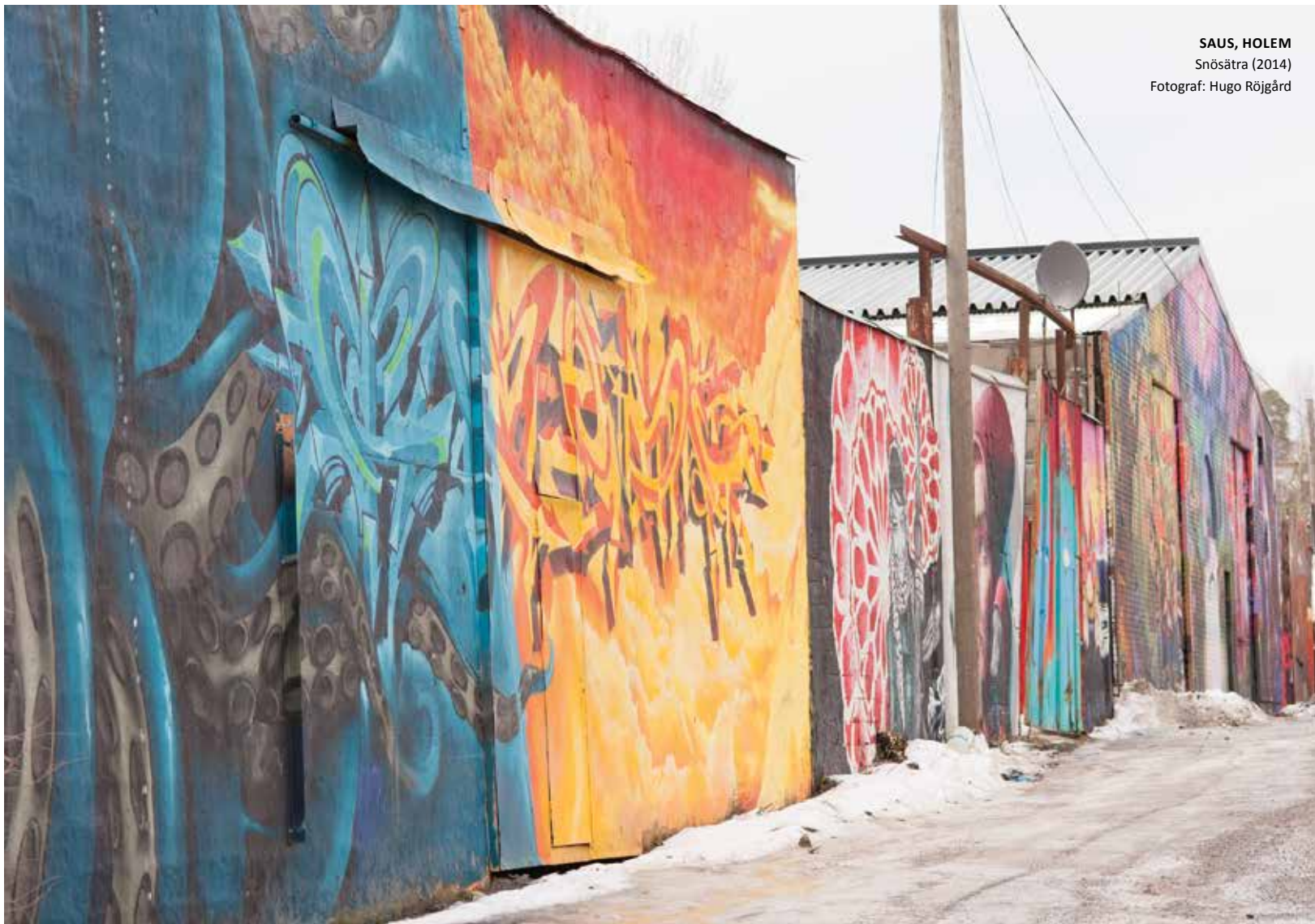
SAUS, HOLEM Snösätra (2014)

Här hittar du ytterligare information och kontaktuppgifter till oss som står bakom denna skrift och andra som på olika sätt jobbar med och har kunskap om öppna väggar i Sverige. Bland annat kan du läsa om hur den öppna väggen i Märsta kom till och fungerar idag och hitta länkar till Street Art Örebro, Artscape och No Limit Borås samt flera av de många graffiti- och gatukonstfestivaler som årligen görs runt om i landet. På hemsidan finns också en lista över öppna väggar i Sverige samt kontaktinformation till lokala graffitiämjanden och eldsjälar.