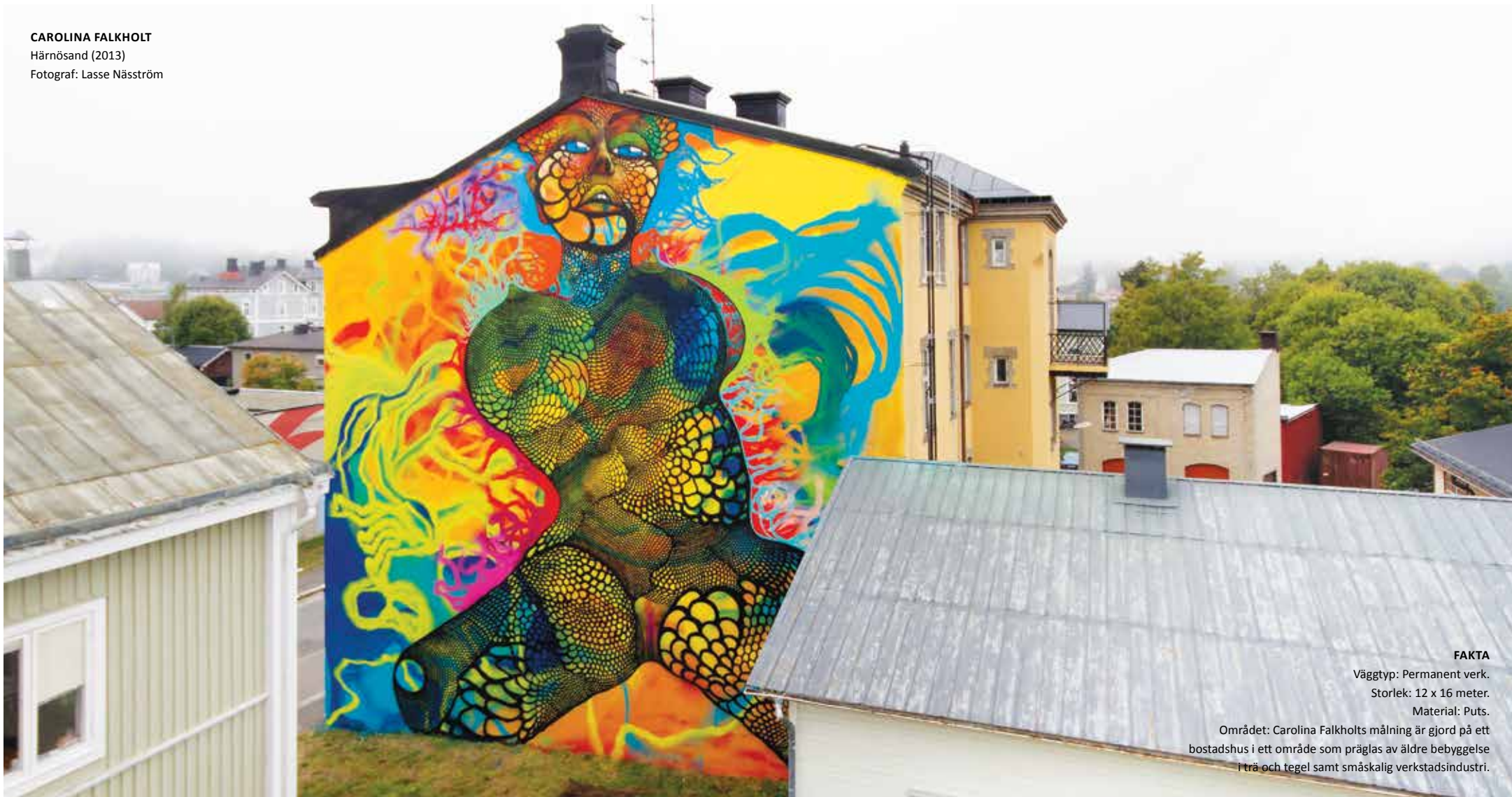
CAROLINA FALKHOLT Härnösand (2013)