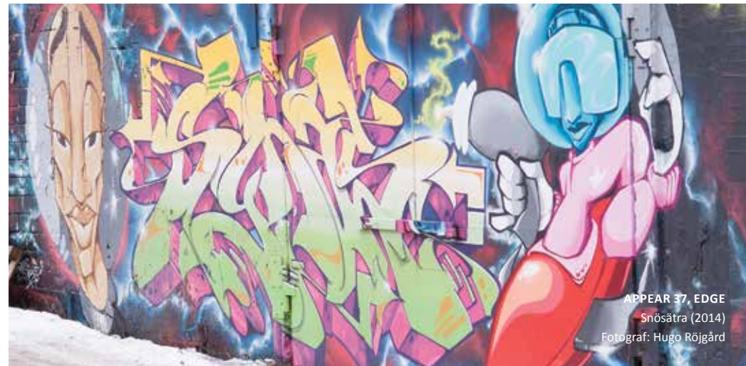
APPEAR 37, EDGE Snösättra (2014)