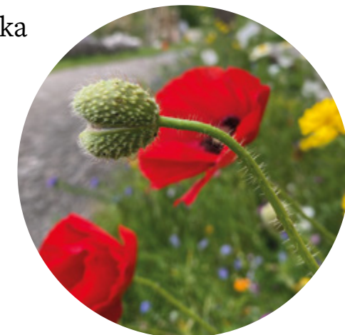
I parken jobbar vi för att det alltid ska finnas något för pollinatörerna – från tidig vår till sen höst.