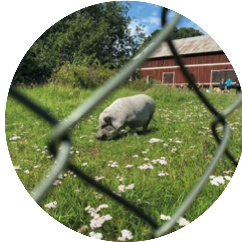
Grisarna hos Hågelby 4H.

Årets nyhet var Folkparksfesten som vi arrangerade i maj tillsammans med flera lokala aktörer. Vi firade som vanligt flera olika högtider, dansade, skrattade till barnteater och bjöd in till andra roliga aktiviteter. Vår stora park fylldes med mycket kul.