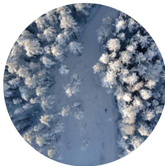
Vy ovanifrån över skidspår.

Det totala besökantalet på arrangerade event ligger på ungefär samma nivå som 2022, vilket fortfarande är mindre än åren innan restriktionerna.