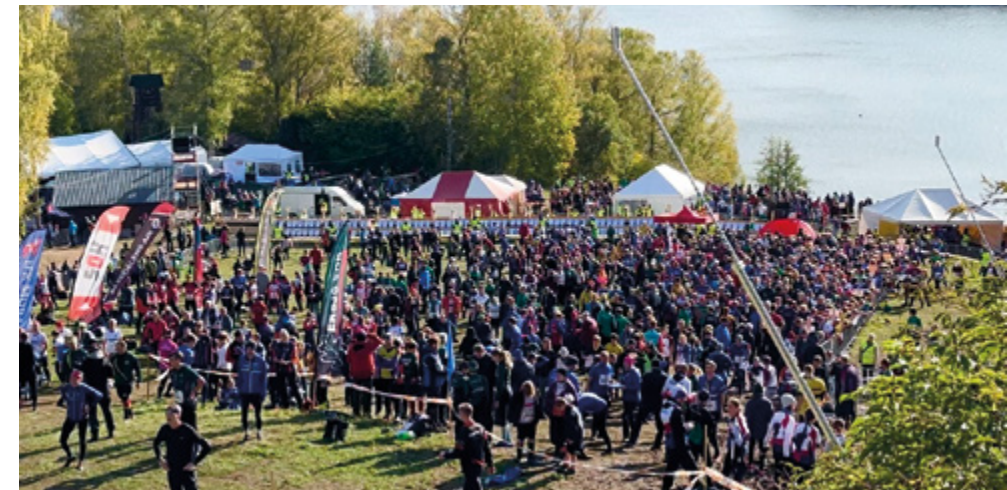
Över 15 000 deltagare under 25manna.

Lilla Loop för barn och ungdomar.