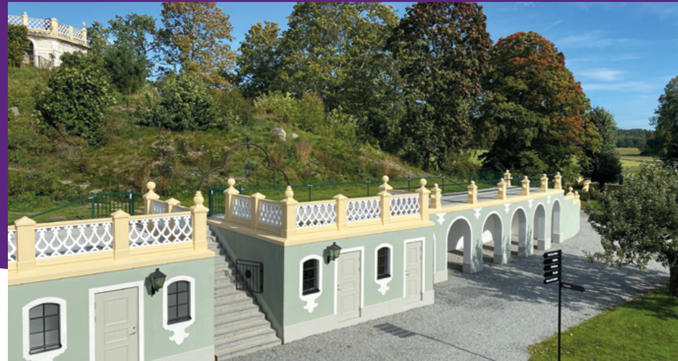
Orangeriet med nya offentliga toaletter är färdigrenoverat.