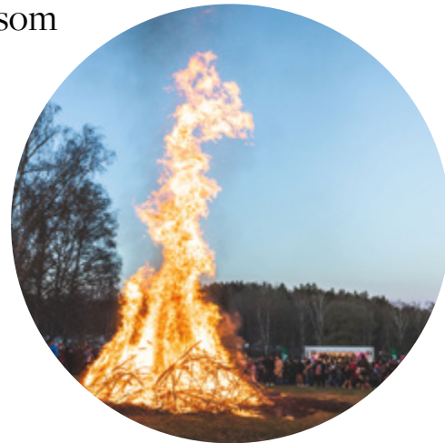
Många samlades runt brasan medan kören sjöng. Foto: Anna Jarlhäll

Nöjda och neutrala besökare (Källa: Lidas besökspanel)