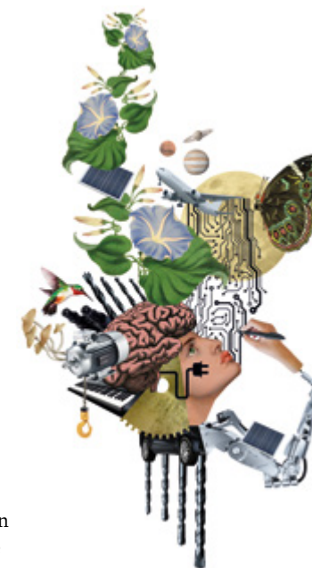
För konferensen Cross Con beställdes en specialdesignad illustration av Sofia Scheutz.

Under 2023 har vi utvecklat våra metoder för uppföljning och analys med vidareutbildning i Google Analytics 4 och en struktur för återkommande uppföljning av digitala kanaler. Vi har även finslipat vår mötesstruktur med syftet att skapa tydlighet och mer insyn för alla på avdelningen.