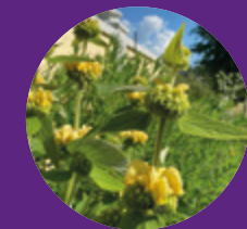
Den ståtliga perennen Gul lejonsvans i Hågelbyparken.