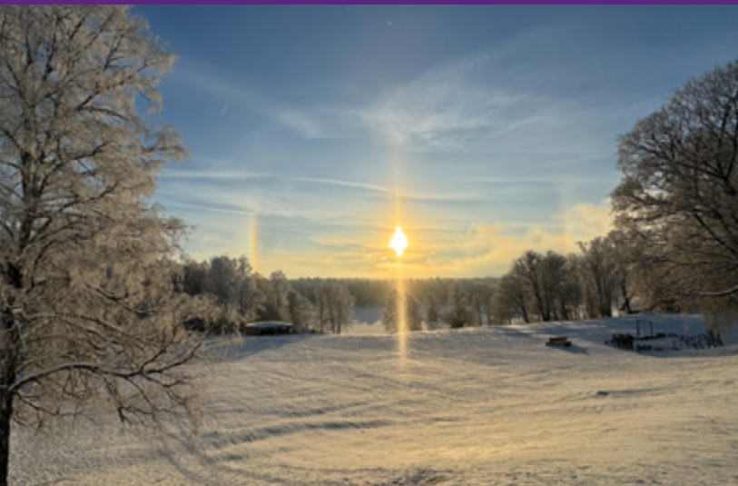
Vintersolen lyser inbjudande över pulkabacken.