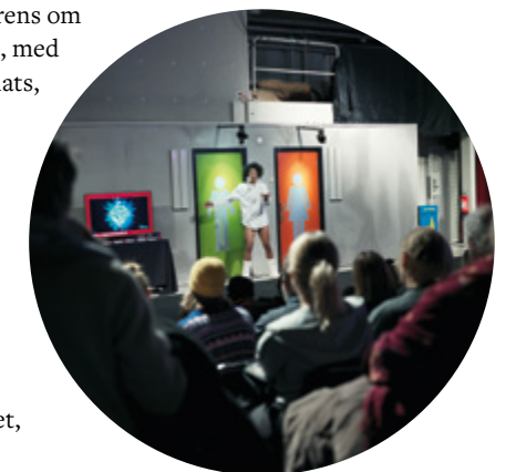
Festivalen CirkusMania invigdes i Hangaren med två föreställningar, bland annat Croûte med Cie Defracto.

Katapult är ordförande för creARTive, den nationella organisationen för kulturinkubatorer i Sverige, och leder sedan 2020 ett strategiskt affärsnätverk av kulturinkubatorer i Norden och Östersjöområdet, Portobello People.