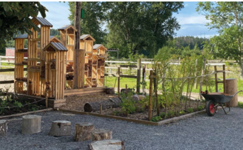
Småkrypens trädgård är en ny del i parken med fokus på biologisk mångfald och pedagogik. Den lekfulla insektsträdgården är skapad i samarbete med Hågelby 4H och Daglig verksamhet och sponsrad av XL Bygg.