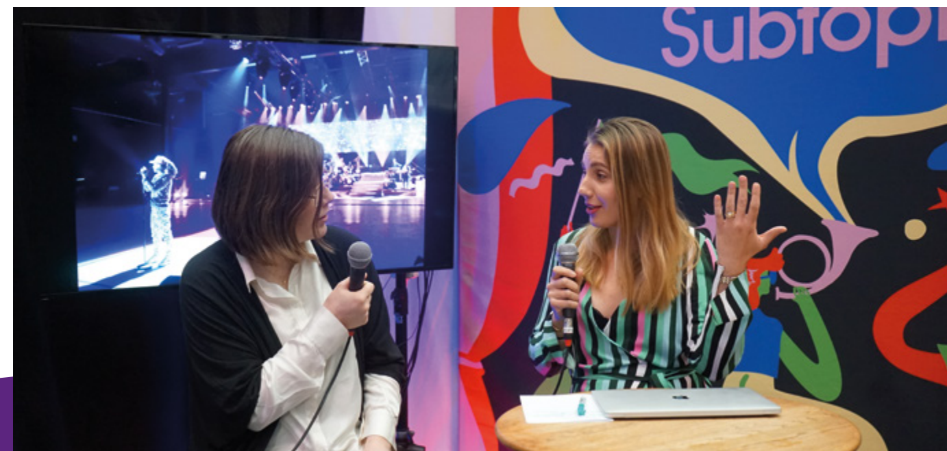
Subtopia hade två föreläsningar och monter under det kulturpolitiska konventet Folk och Kultur.