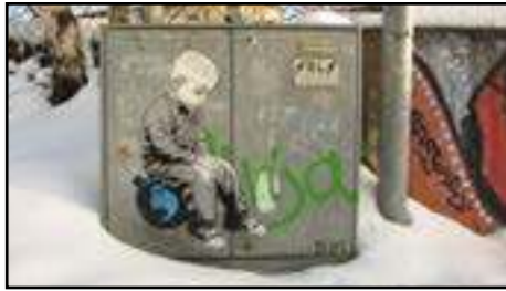
13. Alias | Tyskland | 2014 (Elskåp)

Precis som i verk 9 så föreställer detta verk av Alias ett känslamt och sorgset barn. Varför sitter barnet på en bomb? Är det en vanlig bomb?