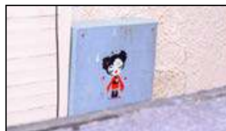
10. Nipponpop | Sverige | 2015 (elskåp)

Enligt Alias säger bilder mer än ord. Detta var en av anledningarna till att han gick från att måla tags till att arbeta med stencilmålningar. Övergången skedde i samband med att han flyttade till Hamburg sent 90-tal, där stenciltekniken då hade börjat ta form. Återkommande i Alias konst är känslolagda och sorgsna bilder på barn. Det är dock inte alltid barnets historia han vill berätta, istället kan man se hans verk som samhällskritiska kommentarer. Han har även skapat verk 13, 18 och 19.