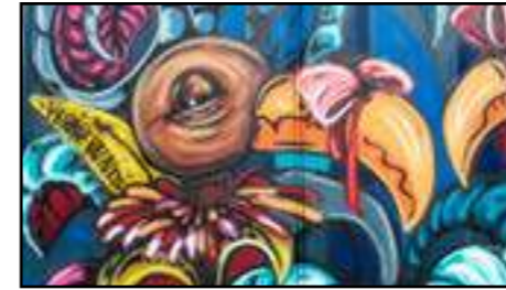
19. Pernie Paints | Sverige | 2022 (porten till Studio 3)

Perinie Pints inspireras av naturen och målingarna föreställer ofta växter och svampar och ibland djur. Människor och vårt samhälle kan anas i bilderna men de är aldrig huvudpersonen. Istället får vi vara åskådare till naturens värld. I Subtopias utomhusgalleri har hon målat Sekretessarinnan. En gam med tjugigt burr runt halsen och en rosett runt näbben. Namnet kommer sig av sekretess-, hon kan inget säga men lyssnar gärna, och - arinnan som någon som är ståtlig.