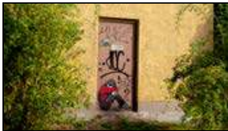
18. Alias | Tyskland | 2014 (lilla huset)

Andra verket av Nipponpop är identiskt med det första.