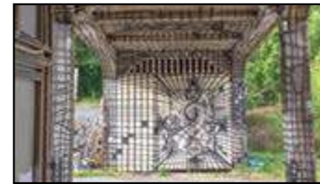
22. Puppet Industries | Sverige | 2015 (bron)