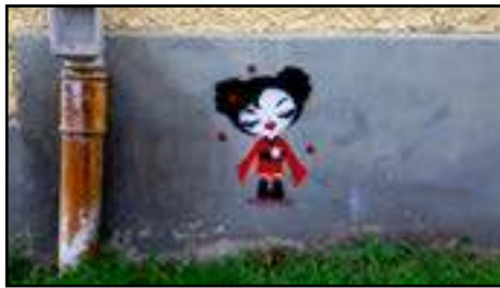
17. Nipponpop | Sverige | 2015 (stupränna och elsåp vid trapporna)