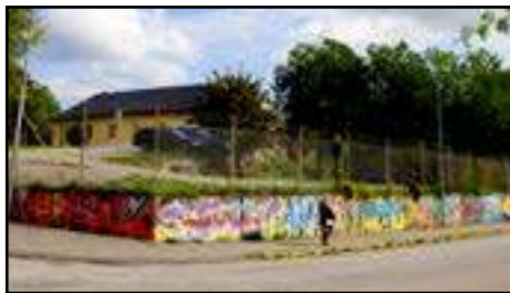
15. Hoodsfredsfestivalen | 2006 (muren längs Rotemannavägen)

Lola är en grupp konstnärer som ofta arbetar med offentlig utsmyckning. Medlemmarna är även verksamma vid Konstfack och driver galleri. 2009 skapade de ett landmärke åt Subtopia i form av en gigantisk arm som fungerar som både belysning och riktmärke. Armen är en (förstorad) kopia av cirkusartisten Fefe Deijfens arm.