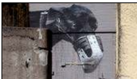
2. Sit | Holland | 2013 (förrådsdörr strax bakom muren)

SIT har en bakgrund inom reklambranschen. Idag använder han sin konst till att skapa dialog och belysa vad han tycker är rätt och fel i samhället. Till målningen på Subtopia kom inspirationen just från SITs erfarenhet av att ha varit en del av "the rat race", som han kallar sin tid inom reklambranschen. Hundarna representerar den värld vi lever i, där vi är programmerade att jaga ett mål som vi inte vet om vi kommer nå.