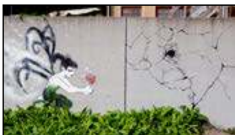
3. Ver Tisoy | Sverige | 2015 (muren längs med nedre trappan)

I systemverket till verk 1 av Sit ser vi en hund som inte längre springer och ser sorgsen ut.