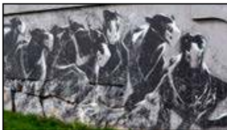
1. Sit | Holland | 2013 (muren vid gräsmattan)

SIT har en bakgrund inom reklambranschen. Idag använder han sin konst till att skapa dialog och belysa vad han tycker är rätt och fel i samhället. Till målningen på Subtopia kom inspirationen just från SITs erfarenhet av att ha varit en del av "the rat race", som han kallar sin tid inom reklambranschen. Hundarna representerar den värld vi lever i, där vi är programmerade att jaga ett mål som vi inte vet om vi kommer nå.