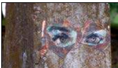
5. Adine | Usa | 2018 (under trädet samt på pelare vid muren)

Fröet till Lott Alfreds neon-löv såddes av en pojke från Storvreten. Verket tillkom som en del av ett projekt som belyste vad som får synas i den offentliga miljön, där barn ofta är underrepresenterade. I projektet samarbetade konstnären därför med barn och ungdomar för att uppmärksamma deras uttrycksformer. Med neonkonsten vill Lott synliggöra symboler som vi alla delar, och visa på en skaparförmåga som alla har. För henne symboliserar lövet att en tanke kan få form, och att en idé kan gestaltas.